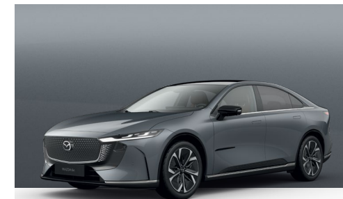
POLYMETAL GREY | €1.050 €882,35