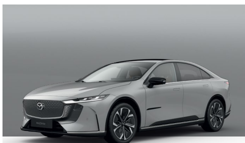
AERO GREY | €850 €714,29