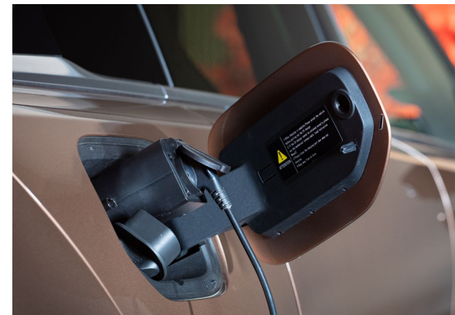
VEHICLE-TO-LOAD (V2L) ADAPTER