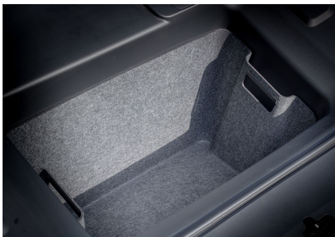
GEPÄCKRAUMEINSATZ (FRUNK BOX)