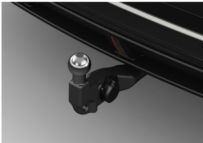
ANHÄNGEZUGVORRICHTUNG, ELEKTRISCH SCHWENKBAR