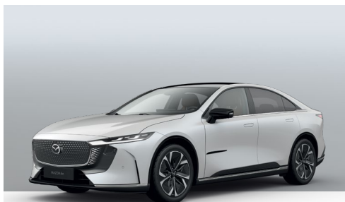
CRYSTAL WHITE PEARL | ohne Aufpreis