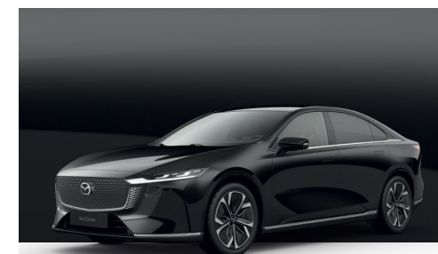
JET BLACK | €850 €714,29

Verwenden Sie unseren Konfigurator, um den Mazda6e zu finden, der perfekt zu Ihnen passt.