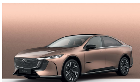
MELTING COPPER | €850 €714,29