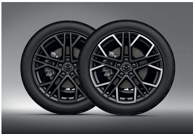
19-ZOLL-LEICHTMETALLFELGE, DESIGN 77, ANTHRAZIT GLÄNZEND / DESIGN 77A, DIAMANTSCHLIFF