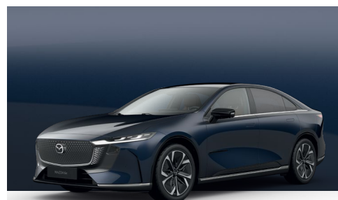
DEEP CRYSTAL BLUE | €850 €714,29