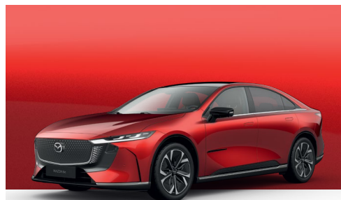
SOUL RED CRYSTAL | €1.200 €1.008,40