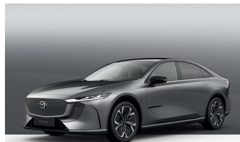
MACHINE GREY | €1.050 €882,35