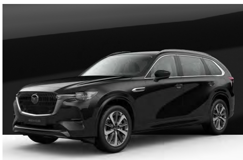
JET BLACK | €850 €714,29

Verwenden Sie unseren Konfigurator, um den Mazda CX-80 zu finden, der perfekt zu Ihnen passt.