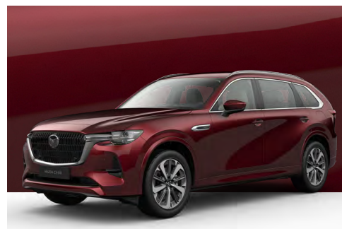
ARTISAN RED | €1.200 €1.008,40