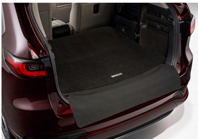
KOFFERRAUMMATTE MIT LADEKANTENSCHUTZ (FÜR HERUNTERGEKLAPPTTE 3. SITZREIHE)