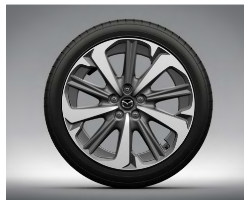
20-Zoll-Leichtmetallfelgen – Diamantschliff (TAKUMI UND TAKUMI PLUS)