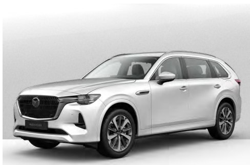
RHODIUM WHITE | €1.050 €882,35