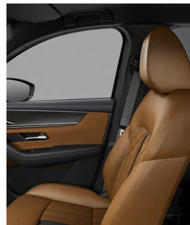
Sitzbezüge aus Teil-Nappaleder in Hellbraun 2) (OPTIONAL FÜR HOMURA UND HOMURA PLUS)