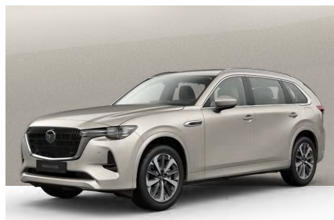
PLATINUM QUARTZ | €850 €714,29