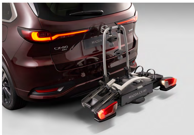
HECKFAHRRADTRÄGER FÜR ZWEI FAHRRÄDER