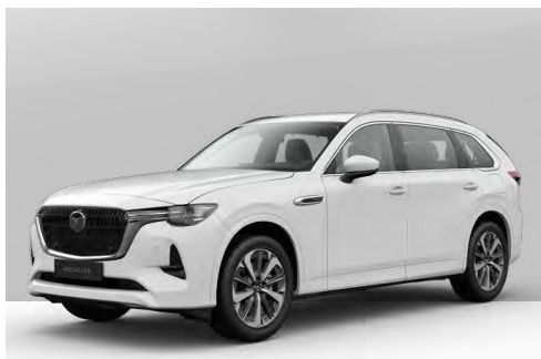
ARCTIC WHITE | ohne Aufpreis