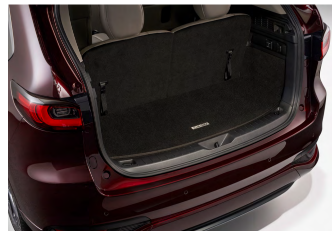
KOFFERRAUMMATTE MIT LADEKANTENSCHUTZ (FÜR HOCHGEKLAPPTTE 3. SITZREIHE)