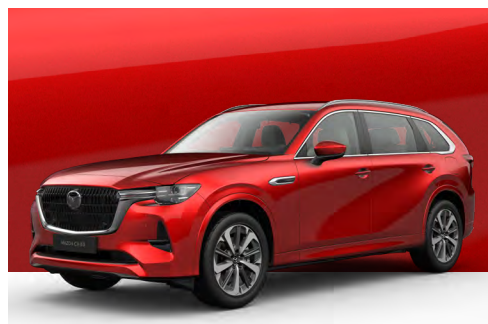
SOUL RED CRYSTAL | €1.200 €1.008,40