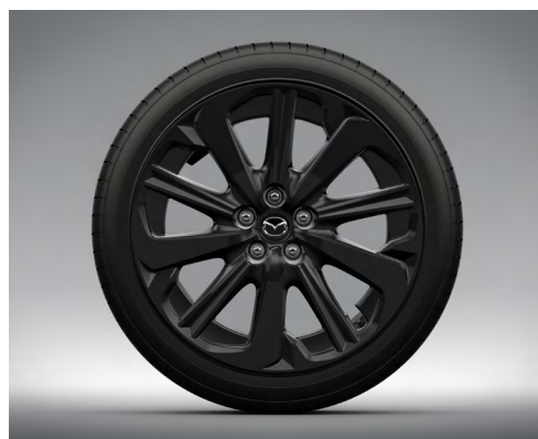
20-Zoll-Leichtmetallfelgen – Schwarz (HOMURA UND HOMURA PLUS)