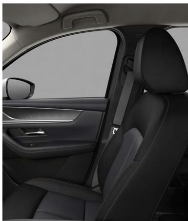
Sitzbezüge aus Stoff in Schwarz (EXCLUSIVE-LINE)