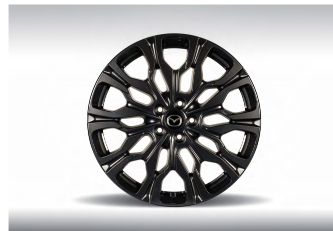
20-ZOLL-LEICHTMETALLFELGE, SCHWARZ MATT