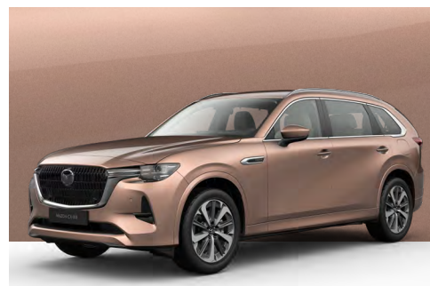
MELTING COPPER | €850 €714,29