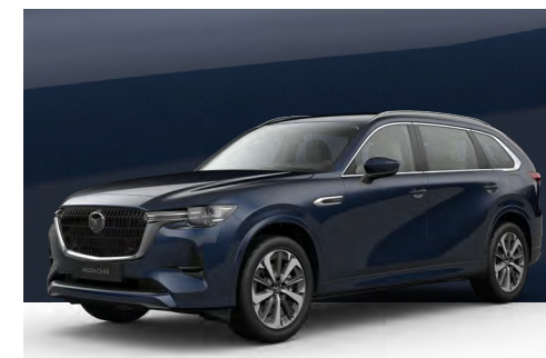
DEEP CRYSTAL BLUE | €850 €714,29