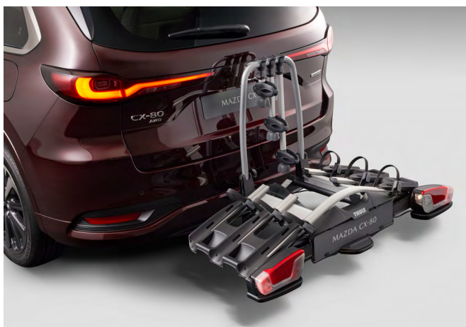
HECKFAHRRADTRÄGER FÜR DREI FAHRRÄDER