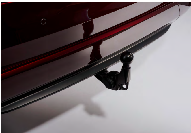
ANHÄNGEZUGVORRICHTUNG, TEIL-ELEKTRISCH SCHWENKBAR