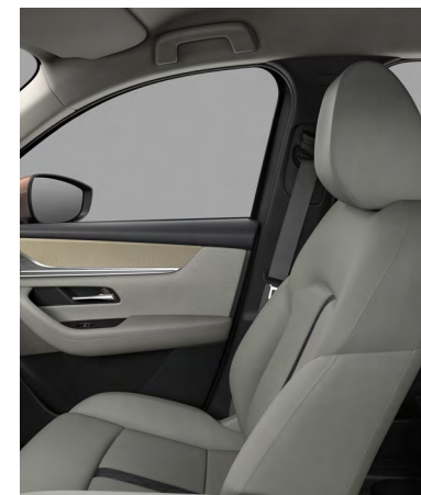
Sitzbezüge aus Nappaleder in Weiß 1) (TAKUMI UND TAKUMI PLUS)