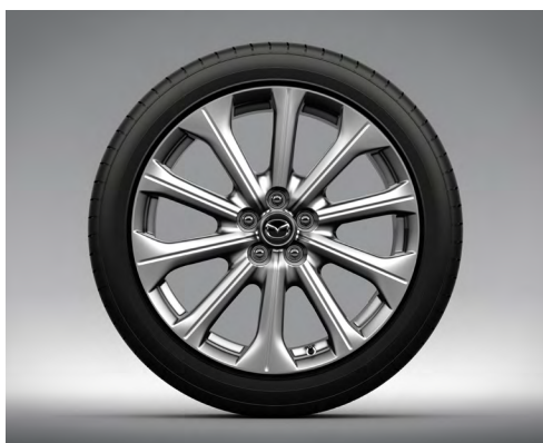
20-Zoll-Leichtmetallfelgen – Silbergrau mit Hochglanzfinish (EXCLUSIVE-LINE)