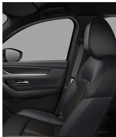
Sitzbezüge aus Nappaleder in Schwarz 1) (HOMURA UND HOMURA PLUS)