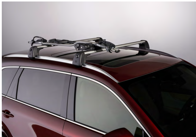
FAHRRADTRÄGER FÜR EIN FAHRRAD