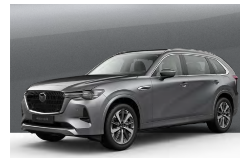
MACHINE GREY | €1.050 €882,35