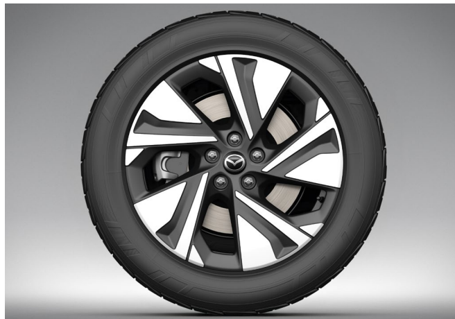
19-Zoll-Leichtmetallfelge im Diamantschliff-Design