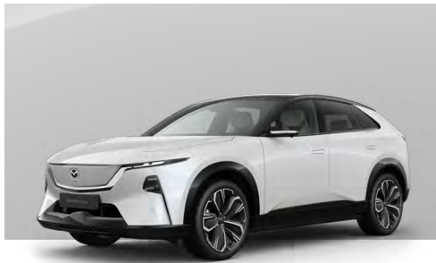
CRYSTAL WHITE PEARL - BLACK | ohne Aufpreis