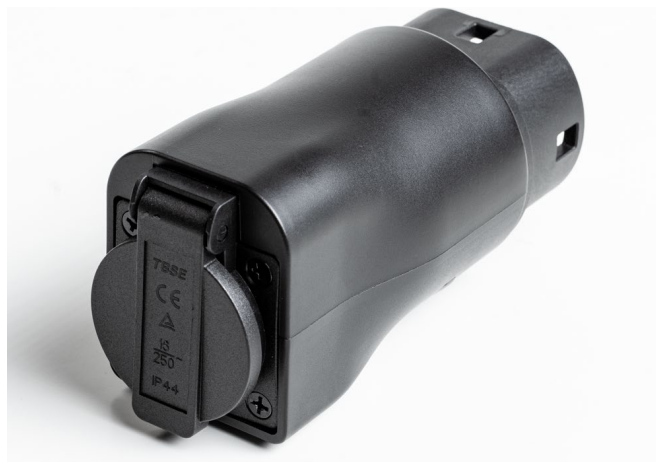
Vehicle-to-load (V2L) Adapter