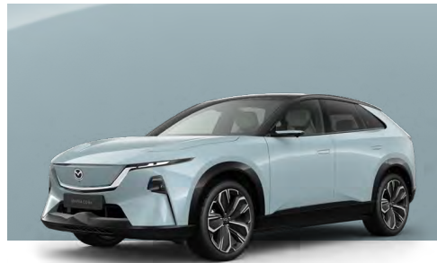
AIR STREAM BLUE - BLACK | €990 €831,93