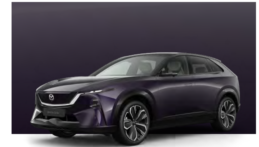
NIGHTFALL VIOLET - BLACK | €1.190 €1.000,00