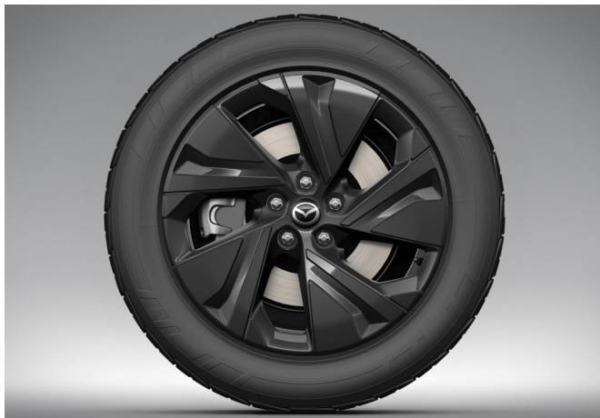
19-Zoll-Leichtmetallfelgen in Schwarz