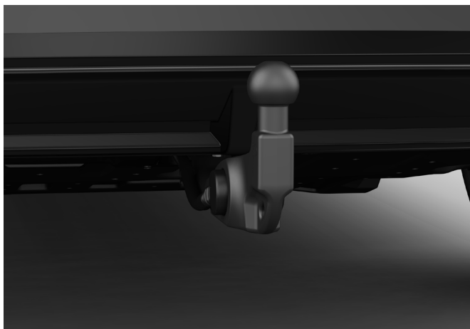
Anhängezugvorrichtung, elektrisch schwenkbar