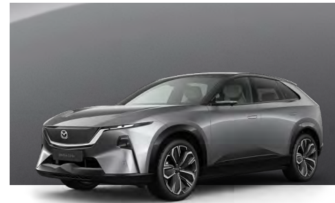
MACHINE GREY - BLACK | €1.190 €1.000,00