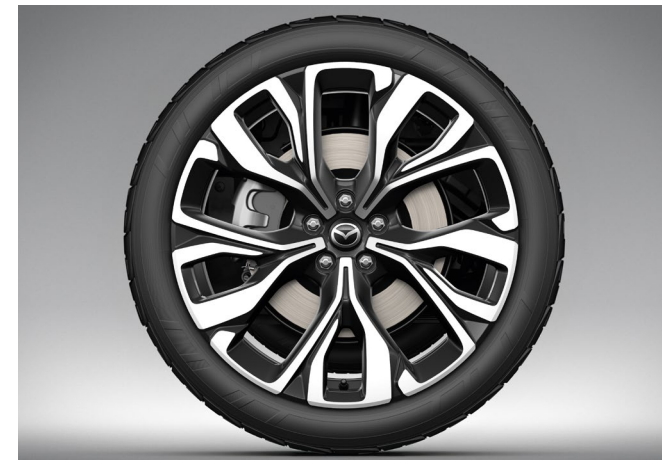
21-Zoll-Leichtmetallfelge im Diamantschliff-Design