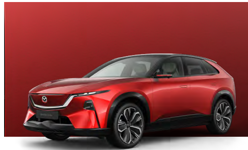
SOUL RED CRYSTAL - BLACK | €1.340 €1.126,05