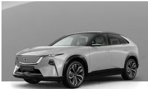
AERO GREY - BLACK | €990 €831,93