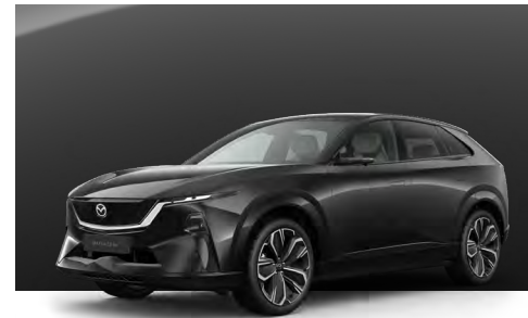
JET BLACK | €990 €831,93

Verwenden Sie unseren Konfigurator, um den Mazda CX-6e zu finden, der perfekt zu Ihnen passt.