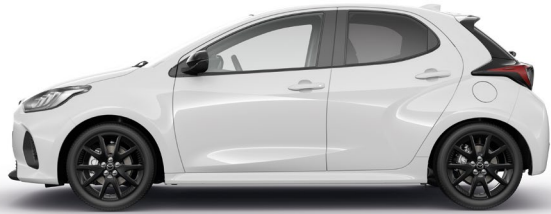
LUNAR WHITE (A8D)