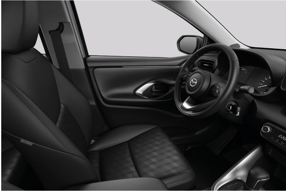
Stoffpolster in Schwarz für Prime-, Centre- und Exclusive-Line