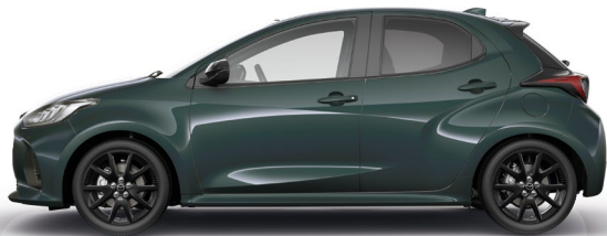
FERN GREEN (53A) 1)