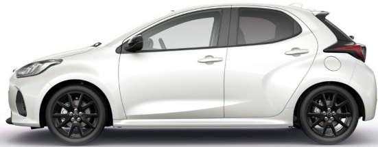
NORTHERN WHITE PEARL (48D) 2)