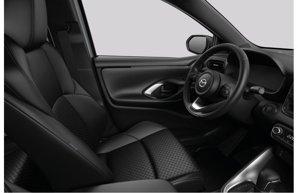
Sportsitze in Schwarz für Homura und Homura Plus*