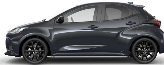
CHARCOAL GREY (A4P) 1)