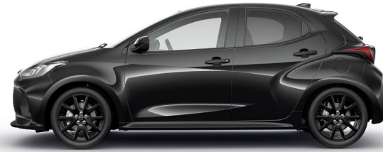
OPERA BLACK (49W) 1)