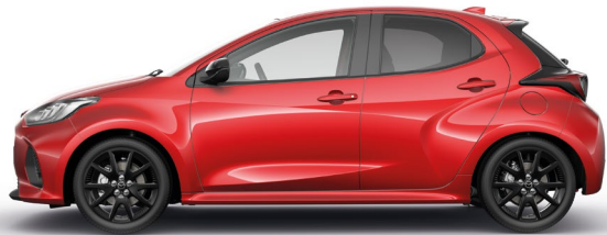
FORMAL RED (A9V) 2)