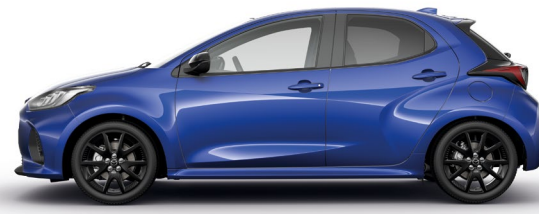
GLASS BLUE (50G) 1)