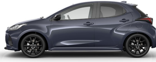
SKY GREY (52Y) 1)