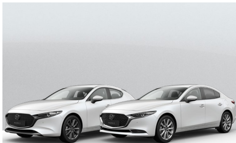
SNOWFLAKE WHITE | €650 €546,22

Verwenden Sie unseren Konfigurator, um den Mazda3 zu finden, der perfekt zu Ihnen passt.