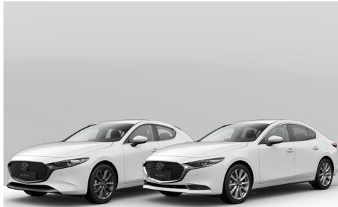
ARCTIC WHITE | ohne Aufpreis