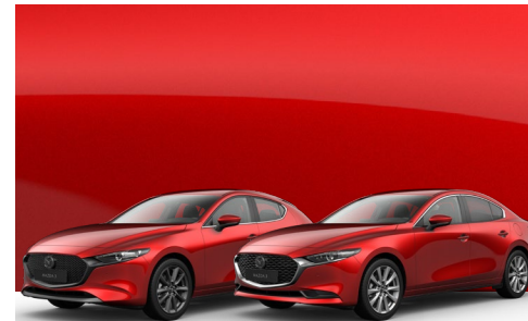
SOUL RED CRYSTAL | €1.000 €840,34