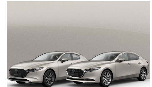
PLATINUM QUARTZ | €650 €546,22