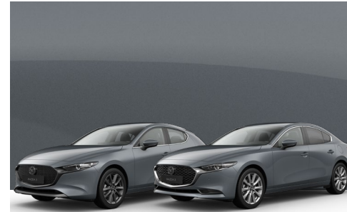
POLYMETAL GREY | €850 €714,29