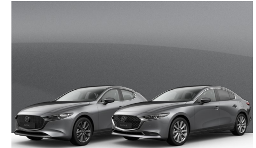
MACHINE GREY | €850 €714,29