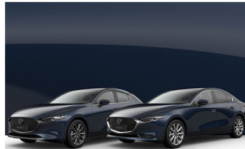
DEEP CRYSTAL BLUE | €650 €546,22