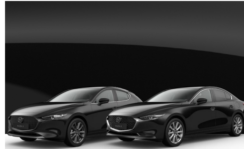
JET BLACK | €650 €546,22