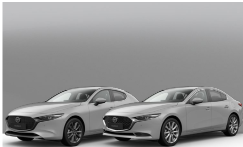
AERO GREY | €650 €546,22