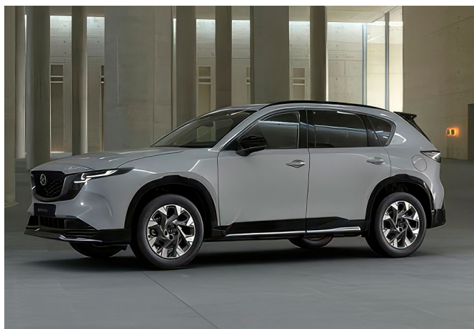
Sportliche Anbauteile (Front- und Heckschürze, Seitenschwellersatz und Dachheckspoiler)