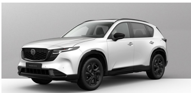
RHODIUM WHITE | 1.050 € 882,35 €