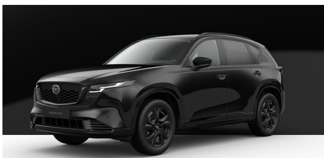
JET BLACK | 850 € 714,29 €