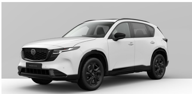
ARCTIC WHITE | ohne Aufpreis