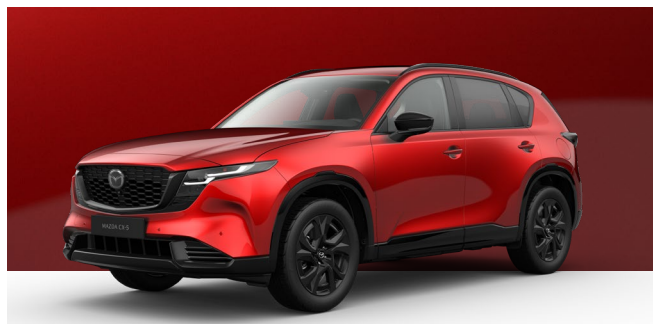
SOUL RED CRYSTAL | 1.200 € 1.008,40 €