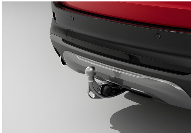
Anhängezugvorrichtung, voll-elektrisch schwenkbar