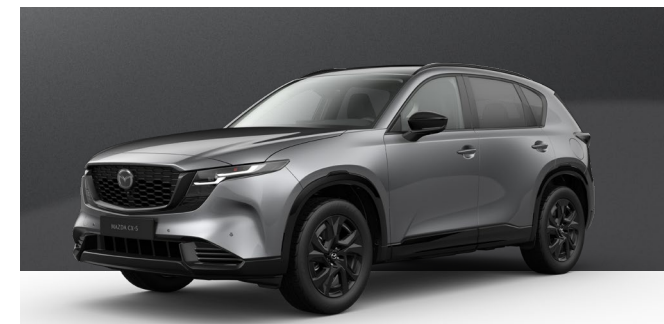
MACHINE GREY | 1.050 € 882,35 €