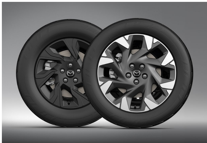
Leichtmetallfelge 17 Zoll (Design 78, schwarz matt) Leichtmetallfelge 19 Zoll (Design 79, Diamantschliff)