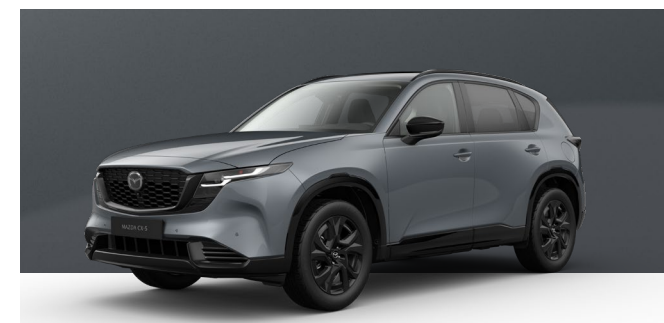
POLYMETAL GREY | 1.050 € 882,35 €