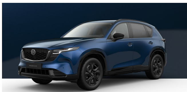
NAVY BLUE | 850 € 714,29 €

Verwenden Sie unseren Konfigurator, um den Mazda CX-5 zu finden, der perfekt zu Ihnen passt.