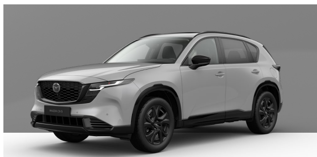
AERO GREY | 850 € 714,29 €